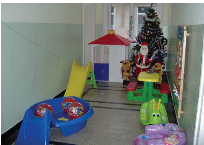
Детски кът в русенската болница, изграден със средства от акцията „Жълти стотинки“ на РК Русе

Членовете на клуба покриват характерните за гр. Русе професии: машиностроене, химическа индустрия, преподавателска дейност, лека промишленост, търговия, медицина, право, изкуство и култура, обществена дейност.