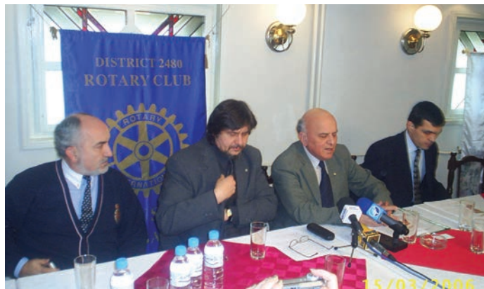
Членове на РК Русе по време на пресконференцията, посветена на кампанията за профилактика и скрининг на рака на простатата

През настоящата ротарианска година в РК Русе членуват 24 ротарианци (в т.ч. 5 жени и 2 почетни членове). Клубът сега има пълна клубна конфигурация. През м. ноември 2001 г. е чартиран Ротаракт, на 3 юни 2006 год. – Интеракт, а на 28 април 2007 год. – Inner Wheel.