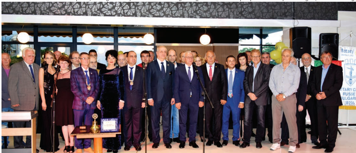
Ротарианци от Русе на тържеството по повод 80-годишнината от чартирането на първия РК Русе (13 май 2017 год.)