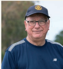
Йън Райзли Президент, Ротари Интернешънъл